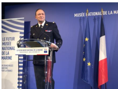
Commissaire général de 1 ère classe Vincent Campredon

Un musée ouvert à tous, ouvert sur le grand large, qui établit des ponts, un pont au cœur de Paris entre Terre et Mer, un pont entre l’histoire et la légende, un pont entre le passé et l’avenir, entre l’éveil et le rêve. Les futurs visiteurs seront invités à prendre la mer pour un embarquement immédiat où les escales seront nombreuses.