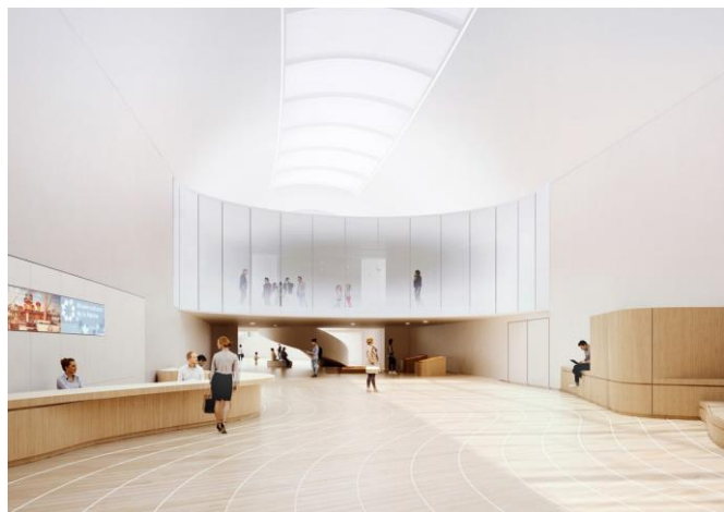
Vues du vestibule d'entrée et du hall d'entrée en galerie Davioud © H2o architectes / Snøhetta